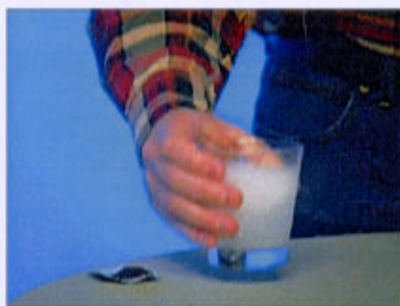
...under mycket lång tid