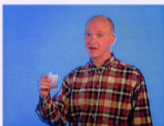
Kanske av gammal vana...