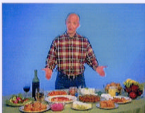
Speciellt om det blir lite för mycket av det goda.