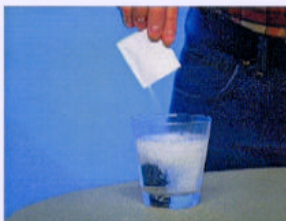
Och faktum är att halsbränna har behandlats på ungefär samma sätt...