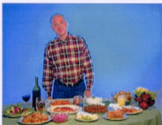
Viss mat och dryck kan ge halsbränna, eller sura uppstötningar.