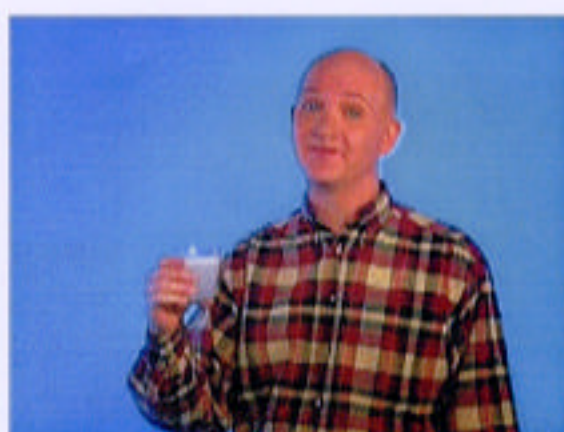
...för det har ju faktiskt hänt en hel del med vetenskapen...