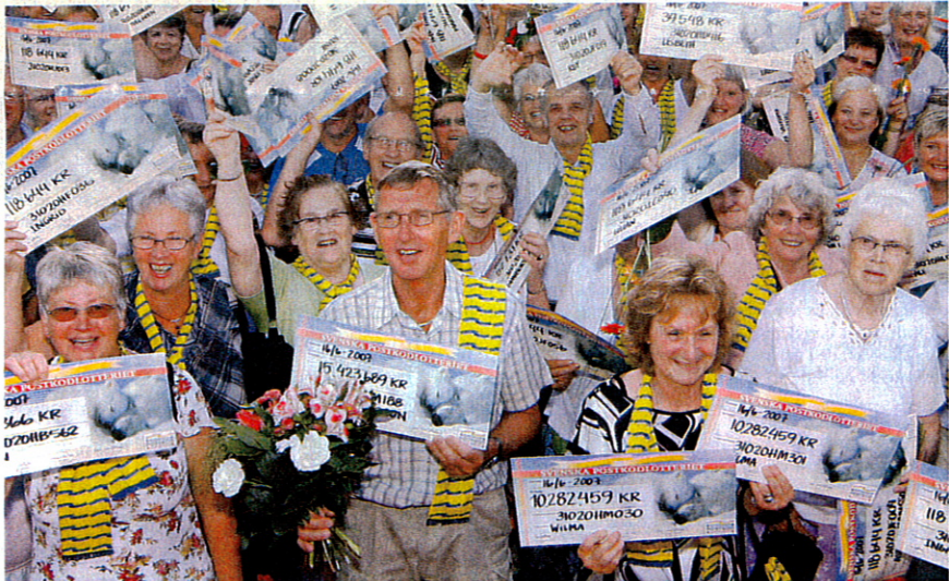
Solen sken ikapp med de 105 vinnarna i GrannYran när PostkodLotteriet i juni kom till Knäred för att dela ut drygt 47 miljoner.

Underhållande vinnare Den största underhållningen stod Knäreds-vinnarna själva för. En del blev helt tysta när de fick sina vinst-