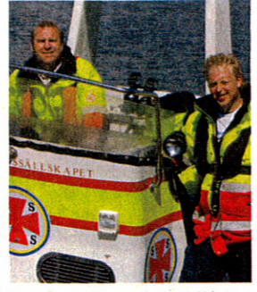
Längs Sveriges kuster står över 1 500 sjöräddare beredda att rycka ut när larmet går.

Det började med ett antal skepp som år 1903 förläste utanför den svenska västkusten. 100 år senare har den förening som man då bildade 1 500 frivilliga sjöräddare på 70 sjöräddningsstationer längs Sveriges kuster och i de 4 största sjöarna.