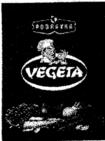
Invändarens varumärkesregistrering nr 354833 (Märket är utfört i färgerna rött, vitt, orange, grönt, svart och brunt mot blå bakgrund)