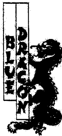
Varumärke 327 450

Till stöd härför har invändaren anfört att de varor som innehavarens märke avser är av liknande slag som de varor som dennes märken omfattar och vidare att märkeslikhet mellan de motstående märkena föreligger. Invändaren har anfört att dennes märke under registreringsnummer 327 450 består av orden BLUE DRAGON placerade i fält som omges av en ram som på ena sidan flankeras av en drake i vertikal position, och vidare att dennes återopade märke, såsom det används, uppvisar sagda text i blått placerad i gula fält omgivna av en blå ram och där den flankerande draken är blå. I anslutning härtill har invändaren anfört att innehavarens märke likaledes består av två ord, DOUBLE DRAGON, vilka återges i ett fält som omges av en ram och som flankeras av två drakar i vertikal position. Invändaren har givit in visst material i form av kopior av annonser för att söka påvisa att det av denne använda varumärket med ovan angivna färgsättning är inarbetat. Denne har vidare