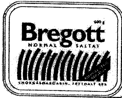
Varumärkesregistrering nr 239 108

Vidare har invändaren anfört att innehavarens märke är förväxlingsbart med registreringen med nummer 239 108, i figur återgiven nedan, avseende samtliga varor, i klass 29.