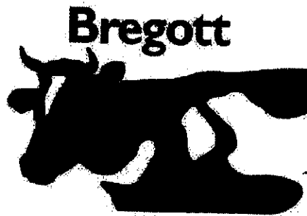
Varumärkesregistrering nr 323 387

Härutöver har invändaren gjort gällande att innehavarens märke är förväxlingsbart med varumärkesregistreringen BREGOTT med nummer 323 387, i figur återgiven nedan, avseende kött, fisk, fjäderfä och vilt; köttextrakt; konserverade, torkade och tillagade frukter och grönsaker; geléer, sylter, fruktkompotter; ägg, mjölk och mjölkprodukter; smör, margarin, ätliga oljor och fetter, i klass 29.