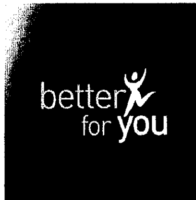
Det sökta märket.

Ärendet avser ansökan om varumärkesregistrering av märket BETTER FOR YOU, i figur nedan angivet, för kött, fisk, skaldjur, fjäderfä och vilt; köttextrakt; konserverade, kylda, värmebehandlade, frysta, torkade och tillagade frukter och grönsaker; geléer, sylter, fruktkompotter; ägg, mjölk och mjölkprodukter; ätliga oljor och fetter; soppor; konserverade, frysta, torkade och tillagade livsmedel innehållande ovanstående, i klass 29, kaffe, te, kakao, socker, ris, tapioka, sagogryn, kaffeersättning; mjöl och näringspreparat tillverkade av spannmål, bröd, konditorivaror, godsaker, snacks och andra livsmedel tillverkade av spannmål, glass, honung, sirap; jäst, bakpulver; salt, senap; vinäger, såser (smaktillsatser); kryddor; is; frukostflingor, pasta och nudlar samt produkter därav, i klass 30, jordbruks-, trädgårds- och skogsbruksprodukter samt spannmål, ej ingående i andra klasser; levande djur; färska frukter och grönsaker; fröer och utsäden, levande plantor, växter och blommor; preparat och produkter innehållande ovanstående för djurskötsel; djurfoder; malt, i klass 31, öl; mineral- och kolsyrat vatten samt andra icke alkoholhaltiga drycker; fruktdrycker och -juicer; safter och andra koncentrat för framställning av drycker, i klass 32 samt alkoholhaltiga drycker (ej öl), i klass 33.