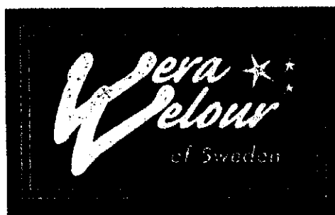
Det sökta märket.

Ärendet avser ansökan om varumärkesregistrering av märket VERA VELOUR OF SWEDEN, i figur återgivet nedan, för kläder, fotbeklädnader och huvudbonader i klass 25.