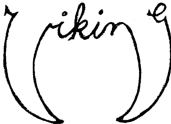
Det sökta märket.

Ärendet avser ansökan om varumärkesregistrering av märket VIKING i figur, återgivet nedan. Ansökan har efter begränsning av varuförteckning i sin slutliga utformning kommit att omfatta golfutrustning samt delar därtill ingående i klassen, i klass 28.