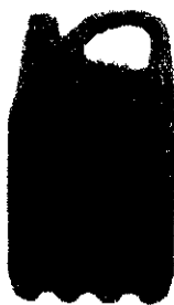
Sökt utstyrsel utförd i blått

Ärendet avser ansökan om varumärkesregistrering av utstyrsel i blå färg, avbildad nedan, för miljöbensin, nämligen alkylatbensin för fyrtaktsmotorer, i klass 4.