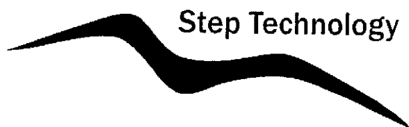
Det sökta märket.

Ärendet avser ansökan om varumärkesregistrering av märket STEP TECHNOLOGY för maskindrivna verktyg för metallbearbetning inkluderande fräsning-, svarvnings-, uppborrnings- och borrarverktyg och skär för sådana verktyg, i klass 7.