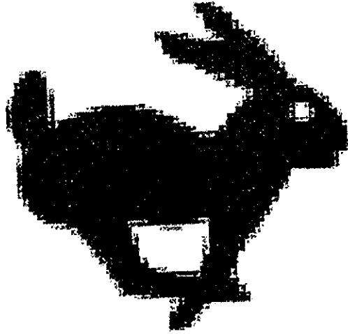
Det motanfödda märket.

PRV har som hinder för märkets registrering anfört att det sökta märket är förväxlingsbart med den nationella varumärkesregistreringen 357804, i figur återgiven nedan, registrerad för bland annat glass och choklad i klass 30.