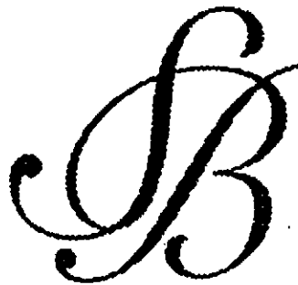
Det motanförla gemenskapsvarumärket 535179.

Vilare har PRV anföril att il sölka märket är förväxlingsbart med gemenskapsvarumärket SB, i figur återgivet nedan, med registreringsnummer 535179, registrerat för registrerat för kodade kort och kort med maskinläsbar information; identitetskort; bankkort; kreditkort; checkkort; kontantkort; kort med magnetiska datamedier; betalkort och smartkort, i klass 9, papper; trycksaker och tryckta publikationer, broschyrer; tryckta plastkort; pappersvaror (skriv- och kontorsmaterial); böcker; tryckta kort, bankkort, kontantkort, betalkort, kreditkort, checkkort, checker, checkhäften, kontorsförlnödenheter, i klass 16, Annonss- och reklamverksamhet; organisation, drift och övervakning av försäljnings- och säljfrämjande program; information och rådgivning avseende alla nämnda tjänster, i klass 35, Kredit-, betal- och bankkortstjänster; försäkringsverksamhet; finansiella tjänster; rabattkortstjänster; tjänster för automatisk betalning; utgivning och inlösen av polletter och kuponger; banktjänster; hypotekstjänster; kredittjänster; information och rådgivning avseende alla nämnda tjänster, i klass 36, telekommunikation, kommunikations- och nätverkstjänster; rådgivning, information och konsulttjänster avseende alla nämnda tjänster, i klass 38, samt undervisning/utbildning och handledning/instruktion, förlagstjänster, underhållning, videoinformationstjänster alla avseende finansiella angelägenheter, i klass 41.