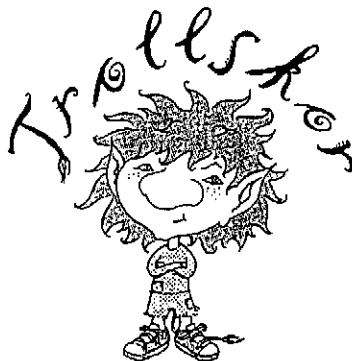
Det sökta märket.

Ärendet avser ansökan om varumärkesregistrering av märket TROLLSKOR, i figur återgivet nedan, för barnskor, i klass 25, samt återförsäljning av barnskor, i klass 35.