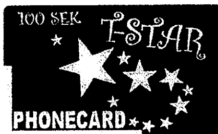
Varumärkesregistrering 377809. Märket är utfört i blått och gult.

Invändningen avser varumärket T-STAR 100 SEK PHONECARD med registreringsnummer 377809 registrerat den 30 december 2005 för papper; kartong samt produkter därav, ej ingående i andra klasser; trycksaker; bokbinderimaterial; fotografier; pappersvaror (skriv- och kontorsmaterial); klister och lim för pappersvaror och hushållsändamål; konstnärsmaterial; målarpenslar; skrivmaskiner och kontorsförnödenheter (ej möbler); instruktions- och undervisningsmaterial (ej apparater); plastmaterial för emballering (ej ingående i andra klasser); trycktyper; klichéer i klass 16. Märket är återgivet nedan.