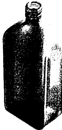
Flaskan är utförd i grönt

Ärendet avser ansökan om varumärkesregistrering av en utstyrsel i färg, avbildad nedan, för alkoholhaltiga drycker nämligen krydd- och örtlikörer, i klass 33.