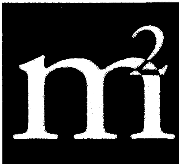
Den motanförla svenska varumärkesregistreringen 327863.

Sökanden har i svaromål anförl att värdering utgör en implicit del av fastighetsmäklari i och med att mäklaren sätter ett pris på fastigheten. Vidare har sökanden anförl att fastighetsmäklari inte innebär en förväxling i förhållande till fastighetsvärdering eftersom värdering endast utgör ett underliggande led till den slutliga tjänsten, nämligen mäklartjänsten. Slutligen har sökanden anförl att i och med den negation som återfinns i varu-/tjänsteförteckningen föreligger ingen förväxlingsrisk.