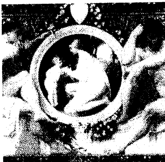
IDYLLE Det sökta märket

Ärendet avser ansökan om varumärkesregistrering av märket IDYLLE. Efter att sökanden begränsat den ursprungligen ingivna varuförteckningen gäller registreringsansökan för kaffe, te, kakao, socker, ris, tapioka, sagogryn, kaffeersättning; mjöl och näringspreparat tillverkade av spannmål, bröd, konditorivaror och godsaker, glass; honung, sirap; jäst, bakpulver; salt, senap; vinäger, såser (smaktillsatser); kryddor; is, i klass 30.