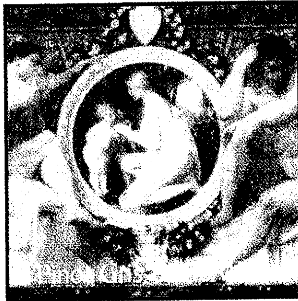
Den sökta märkesändringen

Sökanden har i svar på föreläggande bestridit registreringshindret och i huvudsak anfört att det sökta märket uppfyller kraven på särskiljningsförmåga då det inte är deskriptivt för de sökta varorna och att märket i sig är egenartat. Sökanden har också anfört att eftersom ordet i märkets lydels i sig inte är beskrivande så har märket som helhet särskiljningsförmåga. Sökanden har vidare begärt ändring av det sökta märket genom att lägga till lydelsen PINOT GRIS WHITE WINE, i figur återgivet nedan.