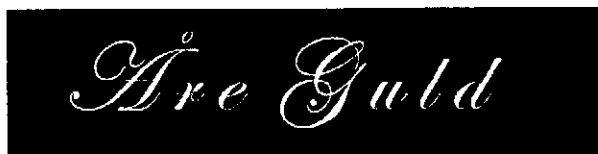
Det sökta märket.

Ärendet avser ansökan om varumärkesregistrering av märket ÅRE GULD i figur, återgivet nedan, för obearbetat eller bearbetat guld; juvelerarvaror; ädelstenar; obearbetat eller bearbetat silver; palladium; platina; rutenium; rodium i klass 14.