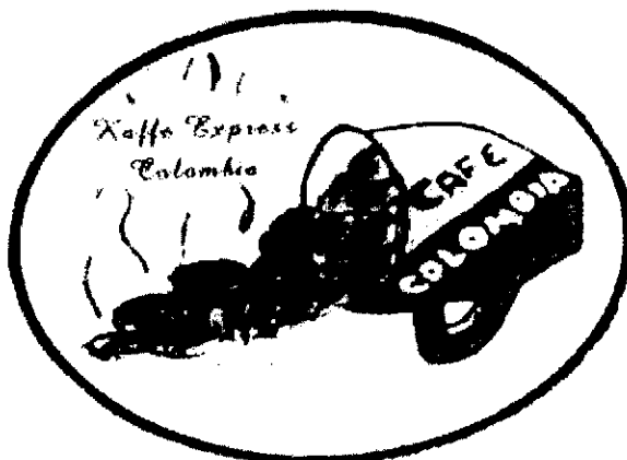
Varumärkesregistrering 376946. Märket utförs i svart, brunt, gult, blått, rött och vitt.

Invändningen avser varumärket KAFFE EXPRESS COLOMBIA CAFE COLOMBIA i figur återgiven nedan, registrerat för colombianskt kaffe i klass 30.