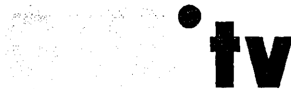
Invändarens gemenskapsvarumärke med reg.nr 2486157

Invändaren yrkar att registreringen skall upphävas och anför som grund för detta att märket är förväxlingsbart med invändarens gemenskapsvarumärke GAY.tv (i figur) med reg.nr 2486157, registrerat för vissa varor i klass 16, bland annat papper och pappersvaror, instruktions- och undervisningsmaterial samt telekommunikation, i klass 38. Märket är återgivet nedan. Invändaren anför vidare följande. Märkeslikheten mellan märkena är påfallande. Vad gäller varuslagslikheten finns mellan tjänsterna tv-reklamverksamhet och telekommunikation uppenbara likheter eftersom tv-reklamverksamhet bedrivs inom ramen för telekommunikation. De båda tjänsterna uppvisar även likheter i sammansättning, de utgör liknande produktioner.