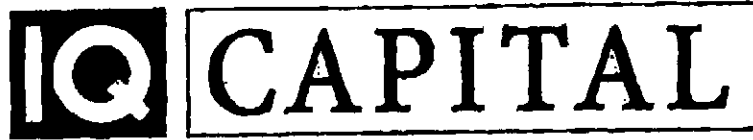
Det motanförla märket, med registreringsnummer 1305382

Gemenskapsvarumärket IQ CAPITAL, i figur återgivet nedan, med registreringsnummer 1305382 för annons- och reklamverksamhet; företagsledning; företagsadministration; kontorstjänster, i klass 35 samt försäkringsverksamhet; finansiella tjänster; monetära tjänster; fastighetsmäklari i klass 36.