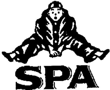
Invändarens gemenskapsvarumärke 140673

registreringsnummer 140673 och SPA, i figur återgivet nedan, med registreringsnummer 470542, vilka båda är registrerade för mineral- och kolsyrat vatten samt andra icke alkoholhaltiga drycker; fruktdrycker och -juicer; safter och andra koncentrat för framställning av drycker, klass 32.