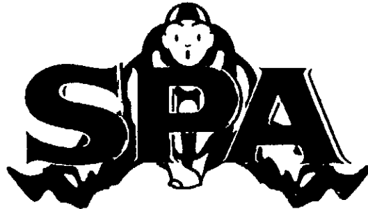
Invändarens gemenskapsvarumärke 470542

Till stöd för invändningen har invändaren i huvudsak anfört följande. Invändarens märke ingår i sin helhet i innehavarens märke. Den gemensamma beståndsdelen SPA får anses utgöra den dominanta delen i innehavarens märke. Visuellt uppfattas märkena som lika. Även uttalsmässigt och konceptuellt är märkena lika. Det föreligger även varuslagslikhet mellan märkena. De varor i klass 32 som omfattas av innehavarens märke är i princip identiska med de varor som invändarens märken är registrerade för. Varuslagslikhet föreligger även beträffande de varor som innehavarens märke avser i klass 29 och 30 och de varor som omfattas av invändarens märken i klass 32 då samtliga av de aktuella varorna omfattar livsmedel och uppvisar likhet både i sammansättning, produktion och förtäring.