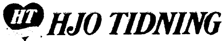
Invändarens inarbetade varumärke.

Invändaren yrkar att innehavarens registrering ska upphävas och anför som grunder härför att innehavarens varumärke är förväxlingsbart invändarens tidigare inarbetade varumärke samt att innehavarens varumärke registrerats i ond tro. Invändarens märke är återgivet nedan.