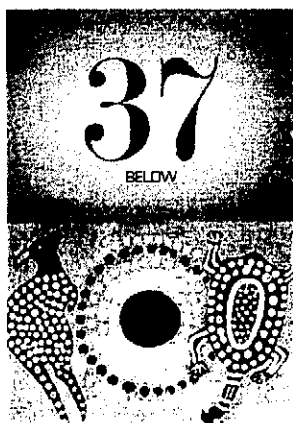
Innehavarens varumärke med reg.nr 388646

Invändningen avser varumärket 37° BELOW, med reg. nr. 388646, i figur återgivet nedan, registrerat den 27 april 2007 för alkoholhaltiga drycker (ej öl) i klass 33.