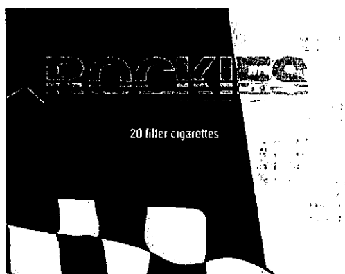
Innehavarens varumärke med registreringsnummer 849624

Invändningen avser varumärket ROCKIES 20 filter cigarettes, i figur återgivet nedan, avseende cigarettes; tobacco; smokers' articles; matches i klass 34.