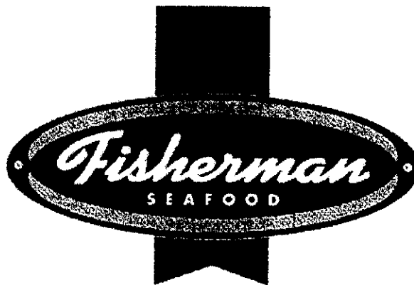
Det sökta märket

Ärendet avser ansökan om varumärkesregistrering av märket FISHERMAN SEAFOOD, i figur återgivet nedan, för fisk & skaldjur i klass 29.