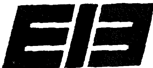
Det motanförla gemenskapsvarumärket med reg. nr 630962.

Invändaren yrkar att registreringen, 393524, ska upphävas avseende varorna i klass 9 och tjänsterna i klass 37. Som grund för sitt yrkande anför invändaren att innehavarens varumärke är förväxlingsbart med invändarens gemenskapsvarumärke EIB i figur, med reg. nr 630962, återgivet nedan, som är registrerat för elektriska och elektroniska anordningar samt elektroniska komponenter och delmonteringar, ingående i klass 9; anordningar och instrument för elektrisk signalering, larm, varning, mätning, räkning, inspelning, indikering, övervakning, provning, kontroll, styrning av öppna och återkopplade system samt för omkoppling; anordningar för inspelning, upptagning, sändning, överföring, mottagning, återgivning, behandling och generering av ljud, signaler och/eller bilder; elektriska anordningar för inspelning, upptagning, bearbetning, sändning, överföring, omkoppling, lagring och utmatning av meddelanden och data; elektriska kablar; optiska fibrer; elektrisk installationsmateriel, ingående i klass 9; installationer bestående av en kombination av nämnda varor; delar till nämnda anordningar och instrument; databehandlingsprogram, ingående i klassen i klass 9, handböcker och andra trycksaker i klass 16, installationstjänster och planering därav i klass 37 och anordnande av handledning/instruktion i klass 41.