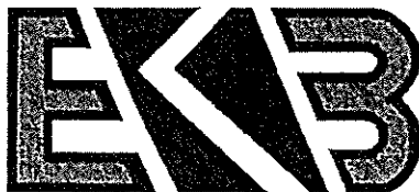
Innehavarens varumärke med reg. nr 393524.

Invändningen avser varumärket EKB i figur, med reg. nr 393524, återgivet nedan, som är registrerat för optiska ledningar, apparater och instrument; apparater och instrument för ledning, växling, transformering, ackumulering, reglering eller kontrollering av elektricitet i klass 9, konsultverksamhet inom administration och företagsledning; marknadsföring av energitjänster i klass 35, uppförande/anläggande av byggnationer inkluderande kraftledningar och belysningsanläggningar; reparationer/underhåll och service; installationstjänster allt inom energi- och infrastrukturuområdet; konsultverksamhet avseende elnätsberedning, elinstallation och inmätningdokumentation; kundinformation och -konsultation avseende eldistributionsanläggningar i klass 37 och distribution av el och energi; kundinformation och -konsultation avseende eldistribution i klass 39.