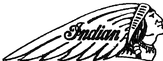
Det motanförla gemenskapsvarumärket med reg. nr 287904.

drycker (ej öl) i klass 33, tobak; artiklar för rökare; tändstickor i klass 34 och utskänkning av mat och dryck; upplåtande av kortvarigt boende; medicinsk, hygienisk och skönhetsvård; veterinära och lantbrukstjänster; juridiska tjänster; vetenskaplig och industriell forskning; datorprogrammering i klass 42.