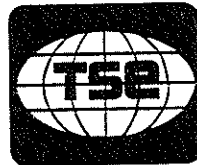
Gemenskapsvarumärke med registreringsnummer 13789

TSE med registreringsnummer 2092179, registrerat för blekningspreparat och andra ämnen för användning vid tvätt; preparat för rengöring, polering och fläckurtagning samt slipmedel; avkalkningsmedel för hushållsändamål; parfymer, eteriska oljor, kosmetika, hårvårdspreparat; tandpulver, -kräm och -pastor, i klass 3, industriella oljor och fetter; smörjmedel och smörjämnen; dammabsorberande, dammfuktande och dammbindande medel; levande ljus och lampvekar för belysning; ljus och veckor för belysning, i klass 4, glasögon, glasögonfodral och solglasögon, i klass 9, ädla metaller och deras legeringar samt varor av ädla metaller eller överdragna därmed, ej ingående i andra klasser, smycken, ädelstenar; smycken, ädelstenar; ur och tidmätninginstrument, i klass 14, blyertspennor för användning vid promotion och reklam, i klass 16, läder och läderimitationer, samt varor framställda av dessa material, ingående i denna klass; djurhudar och pälskinn; koffertar, resväskor och resbagar; paraplyer, parasoller och promenadkäppar; piskor, seldon och sadelmakerivaror; inget för snöbrädsåkning, BMX-körning eller rullbrädsåkning, i klass 18, möbler, speglar, tavelramar; varor (ingående i denna klass) av trä, kork, vass, rotting, korg, horn, ben, elfenben, valfiskben, snäckskal, bärnsten, pärlmor, sjöskum eller av ersättningar