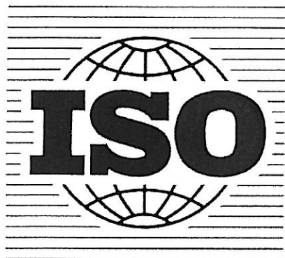
ISO med registreringsnummer 112518

ISO, med registreringsnummer 112520, i figur återgiven nedan, registrerad för trycksaker och andra publikationer, klass 16.