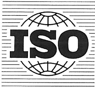
ISO med registreringsnummer 112518

ISO, med registreringsnummer 112520, i figur återgiven nedan, registrerad för trycksaker och andra publikationer, klass 16.