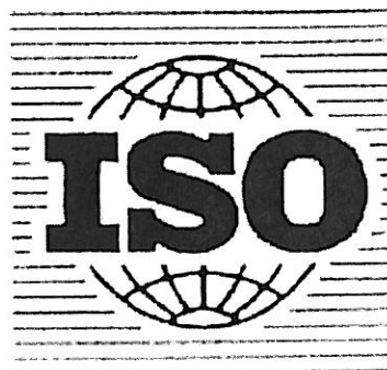
ISO med registreringsnummer 375608