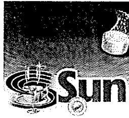
Motanfört varumärke med registreringsnummer 733572

Varumärket SUN, i figur återgivet nedan, med registreringsnummer 734898, för bleaching preparations and other substances for laundry use; cleaning, polishing, scouring and abrasive preparations; dishwashing products; soaps, i klass 3, samt towels impregnated with cleaning and abrasive preparations and substances, i klass 21. Märket är utfört i rött, vitt, gult, blått och grönt.