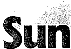
Motanfört gemenskapsmärke med registreringsnummer 2510824

Gemenskapsmärket SUN, i figur återgivet nedan, med registreringsnummer 2510824, för detergenter; preparat och ämnen, allt för användning vid tvätt; preparat för tygbehandling; blekningspreparat; rengörings-, poler-, skur- och slipmedel; preparat för användning vid diskning; tvål; servetter impregnerade med preparat och substanser för rengöring och polering, i klass 3. Märket är utfört i gult och rött.