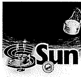
Motanfört varumärke med registreringsnummer 737422

Varumärket SUN, i figur återgivet nedan, med registreringsnummer 737422, för bleaching preparations and other substances for laundry use; cleaning, polishing, scouring and abrasive preparations; dishwashing products; soaps, i klass 3, samt towels impregnated with cleaning and abrasive preparations and substances, i klass 21.