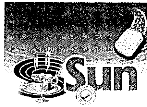
Motanfört varumärke med registreringsnummer 734898

Varumärket SUN, i figur återgivet nedan, med registreringsnummer 734898, för bleaching preparations and other substances for laundry use; cleaning, polishing, scouring and abrasive preparations; dishwashing products; soaps, i klass 3, samt towels impregnated with cleaning and abrasive preparations and substances, i klass 21. Märket är utfört i rött, vitt, gult, blått och grönt.