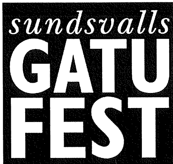
Det sökta märket

Ärendet avser ansökan om varumärkesregistrering av märket SUNDSVALLS GATUFEST, i figur återgivet nedan, för förlagstjänster; utgivning av tidningar; underhållning; kulturverksamhet i klass 41.