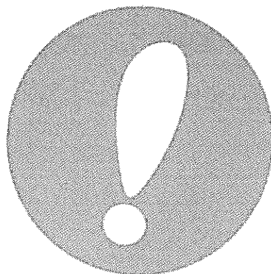
Det sökta märket utförs i grönt och vitt

Ärendet avser ansökan om varumärkesregistrering av märket !, i figur återgivet nedan, för kött, fisk, fjäderfä och vilt; köttextrakt; konserverade, frysta, torkade och tillagade frukter och grönsaker; geléer, sylter, fruktkompotter; ägg, mjölk och mjölkprodukter; ätliga oljor och fetter i klass 29, kaffe, te, kakao, socker, ris, tapioka, sagogryn, kaffeersättning; mjöl och näringspreparat tillverkade av spannmål, bröd, konditorivaror och godsaker, glass, honung, sirap; jäst, bakpulver, salt, senap, vinäger, såser (smaktillsatser); kryddor; is i klass 30, färska frukter och grönsaker; fröer och utsäden, levande plantor, växter och blommor; djurfoder, malt; jordbruks-, trädgårds- och skogsbruksprodukter samt spannmål, ej ingående i andra klasser i klass 31, öl; mineral- och kolsyrat vatten samt andra icke alkoholhaltiga drycker; fruktdrycker och -juicer; safter och andra koncentrat/preparat för framställning av drycker i klass 32 samt annons- och reklamverksamhet; företagsledning; företagsadministration; kontorstjänster; återförsäljning av dagligvaror, tidningar och böcker i klass 35.