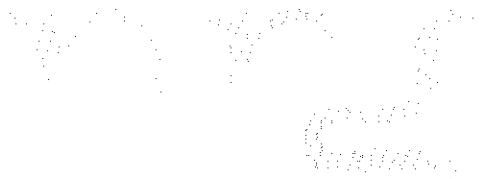
Det sökta märket

Ärendet avser ansökan om varumärkesregistrering av märket NRG, i figur återgivet nedan, för tjänster avseende annons- och reklamverksamhet; undersökningar avseende företags- eller affärsverksamhet samt utvärderingar av affärsverksamhet; företagsledning; företagsadministration; kontorstjänster; sammanställning, lagring, analys och hämtning av data och information; företagskonsulttjänster; rådgivning och assistans vid företagsledning; företagsinformation, kommersiell information och statistisk information; upplåtande av annons- och reklamutrymme inkluderande upplåtande av annons- och reklamutrymme via direktanslutning; informations- och rådgivningstjänster, alla avseende ovan nämnda tjänster, inkluderande sådana tjänster via direktanslutning från ett datornät eller via internet eller extranet i klass 35 samt immaterialrättsliga konsultationer i form av skapande av namn, logotyper eller andra tecken i samband med industriell eller immateriell egendom, inkluderande skapande av varumärken eller logotyper, bolags- eller handelsnamn och/eller områdesnamn samt bevakningstjänster avseende immaterialrättsliga rättigheter i klass 45.