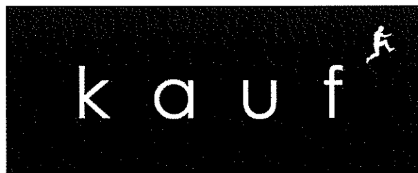
Innehavarens varumärkesregistrering med reg.nr 399501.

Invändningen avser varumärket KAUF i figur, med reg.nr 399501, registrerat den 5 december 2008 för konsulttjänster avseende organisationsutveckling; konsultationer avseende företagsledning och -organisation samt konsultationer avseende företagsledning, i klass 35. Märket är återgivet nedan.