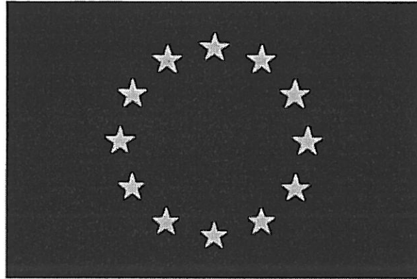
Europarådets emblem med 6ter nr QO188.

Invändaren yrkar att innehavarens registrering upphävs och gör gällande att märket är förväxlingsbart med Europarådets emblem, i figur återgivna nedan.