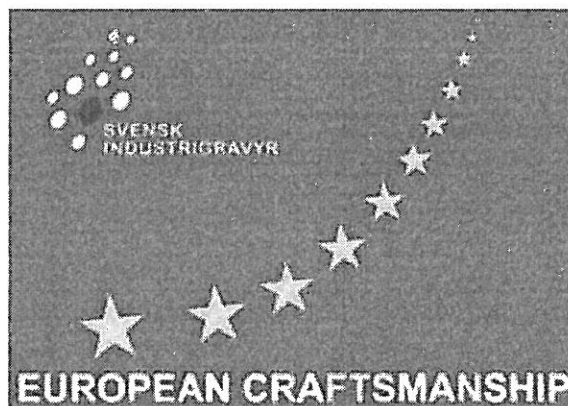
Innehavarens märke med registreringsnummer 402852. Märket är utfört i blått, gult, vitt och rött.

Invändningen avser varumärket SVENSK INDUSTRIGRAVYR EUROPEAN CRAFTSMANSHIP, i figur återgivet nedan, med registreringsnummer 402852, registrerat för gjutformar av metall, i klass 6.