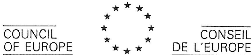
Europarådets emblem med 6ter nr QO189.

Till stöd för invändningen anför invändaren i huvudsak följande. Europarådets emblem finns innefattat i innehavarens märke på ett sådant sätt att konsumenter kan få intryck av ett samband mellan varumärket och rättmätig innehavare av EU-symbolen eller att användningen på annat sätt sanktioneras av Europarådet. Den omständigheten att ordet EUROPEAN utgör en del av innehavarens märke förstärker associationen till Europarådets emblem och ökar risken för förväxling. Europarådets emblem utgörs av gula stjärnor i en cirkel på en blå botten. Det är uppenbart att avbildningen av stjärnor återgivna i gult i cirkulär form på blå botten i innehavarens märke anspelar på och ger en direkt association till Europarådets emblem. Enligt praxis från såväl Tribunalen som OHIM:s besvärskamrar utgör ett innefattande av Europarådets emblem i ett varumärke registreringshinder enligt Pariskonventionens artikel 6ter.