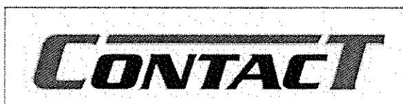
Gemenskapsvarumärke med nr 4712667. Märket är utfört i rött, svart och vitt.

Sökanden har i allt väsentligt bestridit att det sökta märket är förväxlingsbart med de motanförda varumärkena.