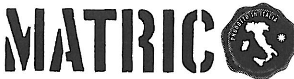
Det sökta märket.

Ärendet avser ansökan om varumärkesregistrering av märket MATRIC PRODOTTO IN ITALIA, i figur återgivet nedan, för kött, fisk, fjäderfä och vilt; köttextrakt; konserverade, frysta, torkade och tillagade frukter och grönsaker; geléer, sylter, fruktkompotter; ägg, mjölk och mjölkprodukter; ätliga oljor och fetter, samliga produkter har sitt ursprung i Italien, i klass 29, kaffe, te, kakao, socker, ris, tapioka, sagogryn, kaffersättning; mjöl och näringspreparat tillverkade av spannmål, bröd, konditorivaror och godsaker, glass honung, sirap; jäst, bakpulver, salt, senap, vinäger, såser (smaktillsatser); kryddor; is, samtliga produkter har sitt ursprung i Italien, i klass 30, samt öl; mineral- och kolsyrat vatten samt andra icke alkoholhaltiga drycker; fruktdrycker och -juicer; safter och andra koncentrat/preparat för framställning av drycker, samtliga produkter har sitt ursprung i Italien, i klass 32.