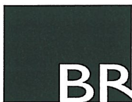
Det motanförda märket med registreringsnummer 5148440

Som hinder för det sökta märkets registrering har PRV anfört att märket är förväxlingsbart med gemenskapsvarumärket BR, med registreringsnummer 5148440, återgivet nedan, registrerat för juridiska tjänster, ej juridiska tjänster i samband med sändningstjänster, i klass 42.