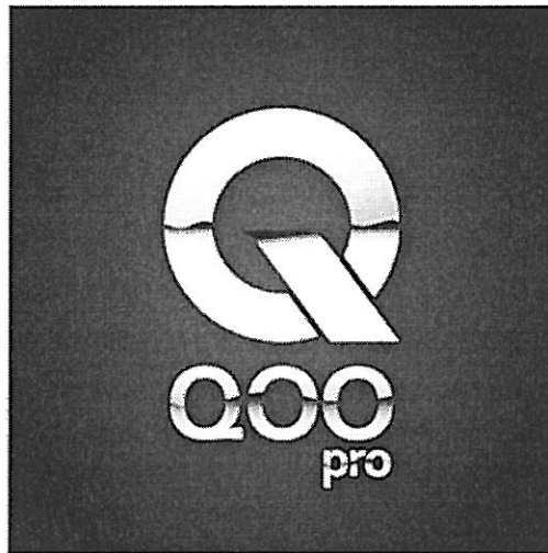
Motanfört märke med registreringsnummer 9207598.

kontroll (övervakning), livräddning och undervisning; apparater och instrument för ledning, distribution, omvandling, ackumulering, justering eller styrning av elektricitet; apparater för inspelning, upptagning, sändning eller återgivning av ljud och bilder; magnetiska databärare, grammofonskivor; försäljningsautomater samt mekanismer för myntstyrda apparater; kassaapparater, räknemaskiner, databehandlingsutrustningar och datorer; eldsläckningsapparat, i klass 9, spel och leksaker; gymnastik- och sportartiklar, ej ingående i andra klasser; julgransprydnader, i klass 28, samt transport; emballering och förvaring av gods; anordnande av resor, i klass 39.