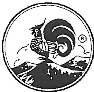
雞標 COCK BRAND MARQUE COQ