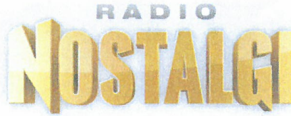
Det sökta märket.

Sökanden har som grund för överföring anfört följande.