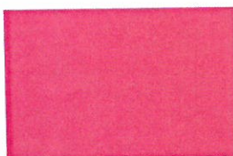
Märket är utfört i magenta.

Invändaren yrkar att innehavarens registrering ska upphävas och anför som grund att märket är förväxlingsbart med invändarens gemenskapsvarumärke som avser ett färgvarumärke med registreringsnummer 212787: